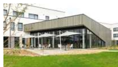
L'équipe de la résidence Les Jardins de l'Aunette